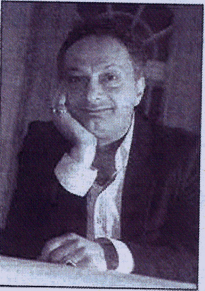
Bekannter Schriftsteller: Feridun Zaimoglu.