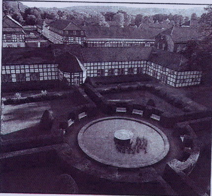
Aus der Vogelperspektive erschließt sich die Schönheit der Schlossanlage besonders gut.

■ Von Matthias Meyer zur Heyde und Oliver Schwabe