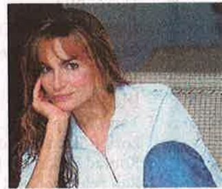
Alexandra Kamp: Sie spielt die Hauptrolle in „Achterbahn“.

hen wird – doch dann kommt alles auf einmal ganz anders. Ist die junge Dame wirklich nur auf ein unverbindliches Abenteuer aus? Wer ist sie wirklich? Und was will sie von ihm? Wer ist sie? Eine Detektivin, von seiner Frau bestellt? Eine Journalistin, die Männer erforscht? Eine Prostituierte, die ihrem Geschäft nachgeht? Der Abend wird zu einer Berg- und Talfahrt der Emotionen . . .