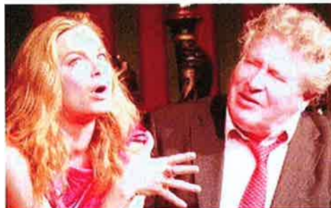
„Um zu plauschen“: Alexandra Kamp und Volker Brandt.

Anders als die parallele Inszenierung mit Peter Bongartz und Susanne Schäfer die im Frühjahr in Hamburg gnadenlos durchgefallen war, gelang es Volker Brandt und Alexandra Kamp von Anfang an ein Gefühl von