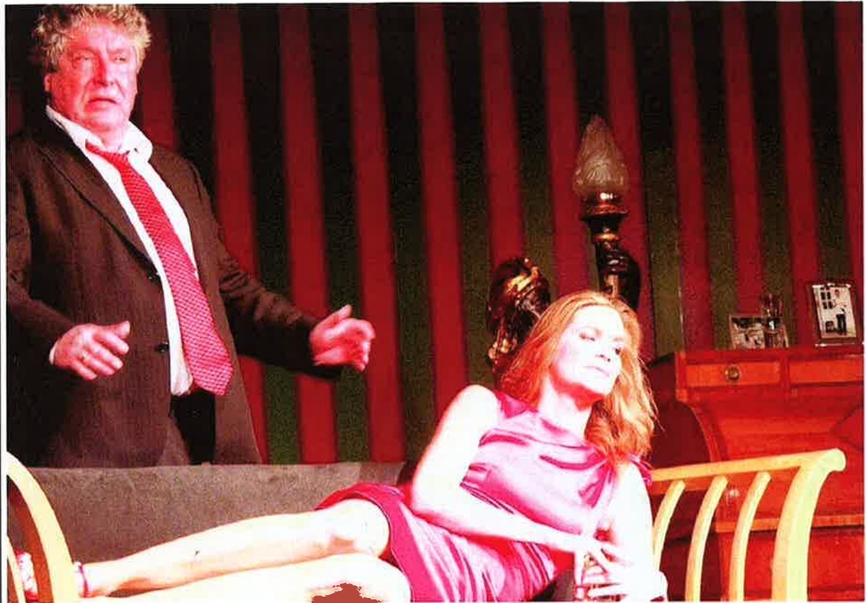
Privatinterieur: Das Bühnenbild ist bis zu den Familienfotos auf dem Sekretär vollständig aus dem Bestand des Gräflichen Hauses zusammengestellt.