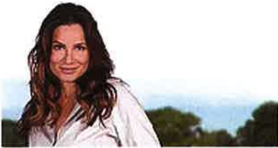
Freut sich auf Bad Driburg

INTERVIEW: Schauspielerin Alexandra Kamp über ihr Theater-Gastspiel in Bad Driburg, gesellschaftliches Engagement und badische Küche