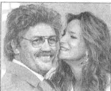
Alexandra Kamp möchte gern mehr komische Rollen spielen, so wie in »Horst Schlämmer – Isch kandidiere!« mit Hape Kerkeling.

Kamp: Ich arbeite an einem Soloprogramm, bei dem ich auch singen werde. Ich würde wahnsinnig gerne auf der Bühne weiterhin starke Frauenrollen spielen wie Ibsens Hedda Gabler oder Nora.