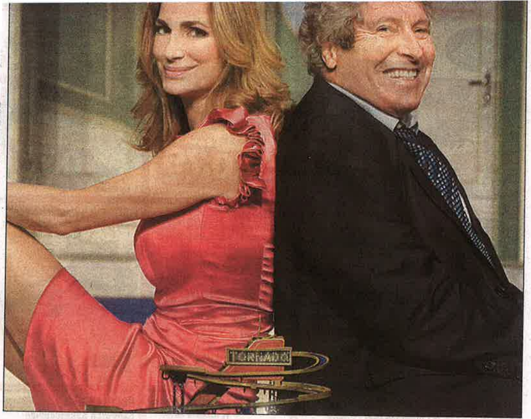
Mit einem eleganten Katz- und Mausspiel | Alexandra Kamp und Volker Brandt am 25. kommen die beiden bekannten Schauspieler | August in den Gräflichen Park.