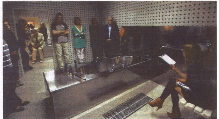
Eine fast unheimliche Stimmung verbreitete sich bei der zweiten Station der Lesung im Badehaus. Hier verteilten sich die Vorleser auf einzelne Behandlungsräume, teils mit kalt glänzenden Badewannen, teils in Massagezellen. Gelesen wurde gleichzeitig in vier verschiedenen Räumen – hier sehen wir die französische Schauspielerin Jeanne Tremal bei ihrem Vortrag